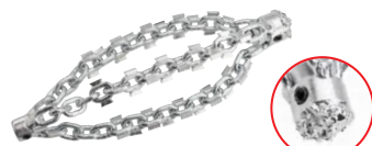
带碳化物刀片的穿透链条敲击器