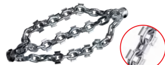
带碳化物刀片的链条敲击器