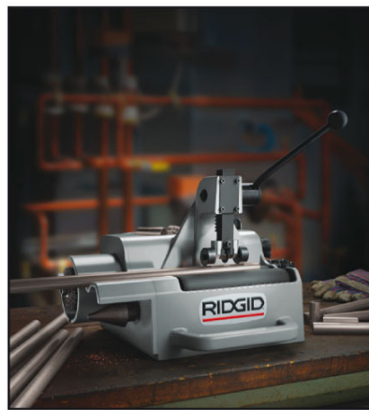
122/122XL型钢管/钢管切割及修理电动机