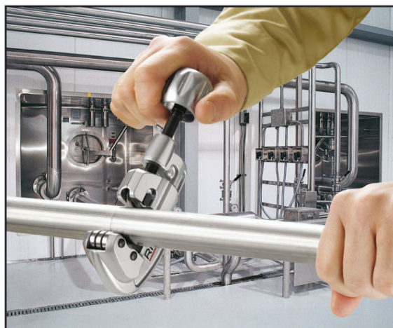
35S型专业不锈钢管割刀