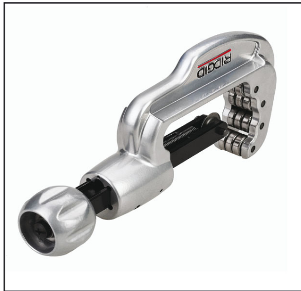
65S型专业不锈钢管割刀